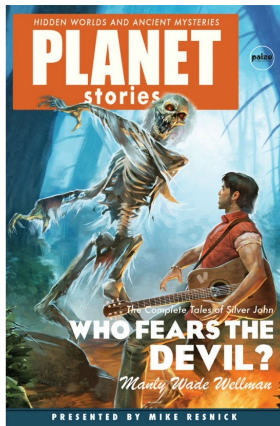
Edition la plus récente des nouvelles de Silver John